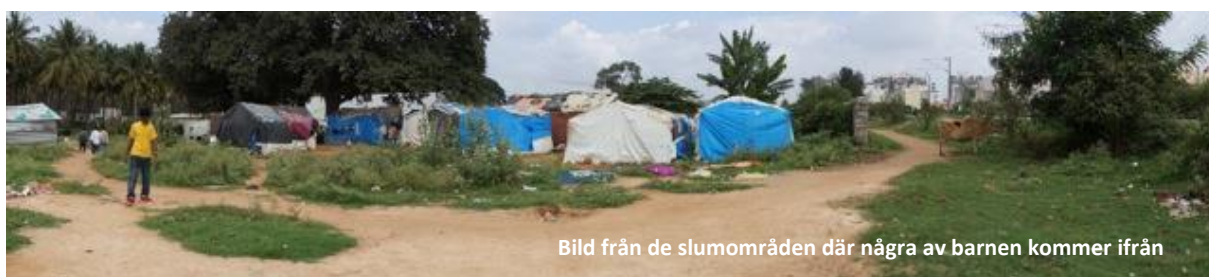
Bild från de slumområden där några av barnen kommer ifrån