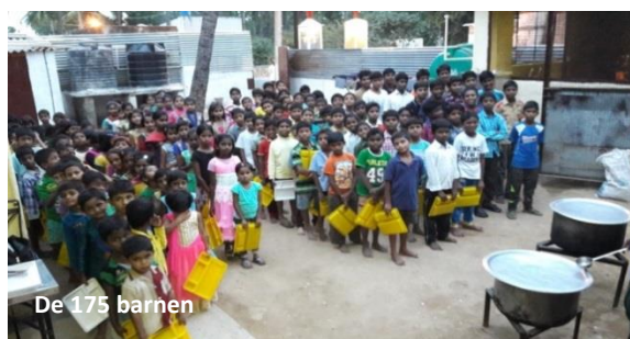
De 175 barnen

Living Hope är en, av de indiska myndigheterna, godkänd icke vinstdrivande hjälpporganisation (NGO) som driver ett barnhem för 175 barn i Bangalore i södra Indien. Målgruppen är att hjälpa barn till extremt fattiga föräldrar, som arbetar på några av de många byggarbeten som pågår i Bangalore. Barnen till föräldrarna går inte i skolan, får inte i sig tillräckligt näringsrik mat och tvingas tidigt in i barnarbete för att överleva. Det innebär